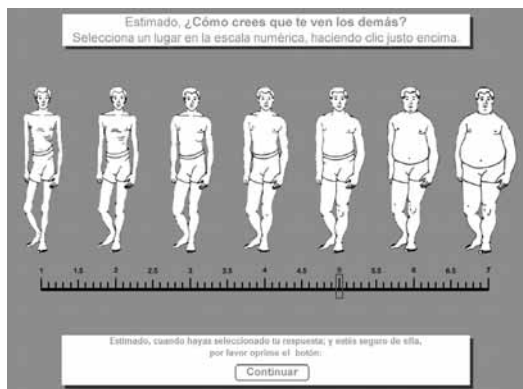
Figura 3 Escala Informatizada para la Estimación del Contorno de la Figura; figura social, versión hombres (Gastélum & Blanco, 2006).

Y la tercera para la imagen social (Figura 3).