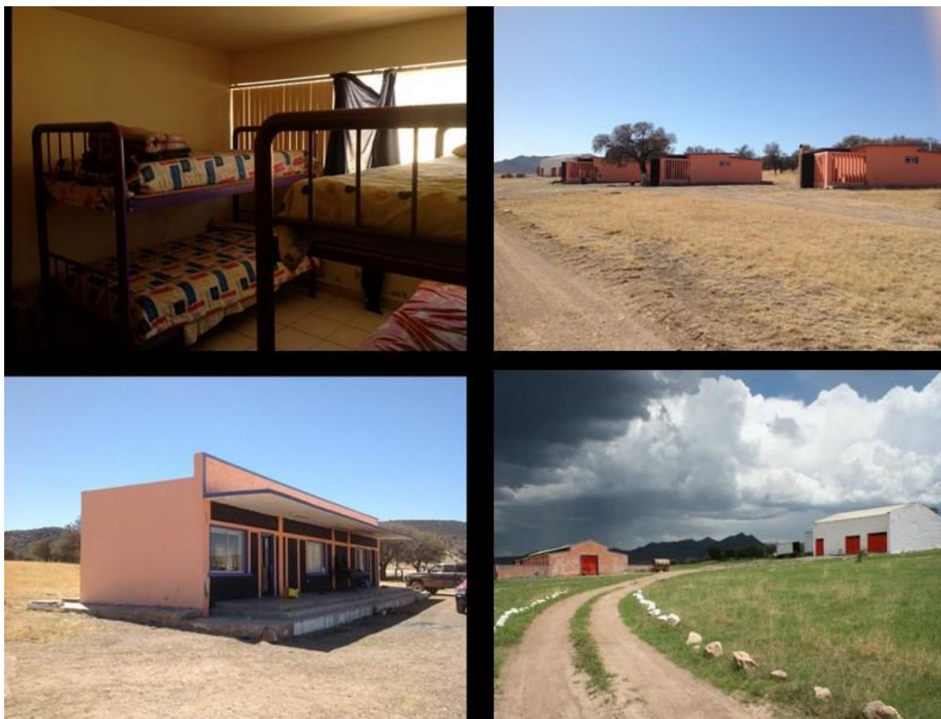
Imágenes de cabañas, comedor e instalaciones del CEITT Teseachi.

Estas cabañas se utilizan para el hospedaje de los estudiantes cuando van a prácticas al CEITT Teseachi, pero está al servicio de toda la comunidad universitaria. En los últimos años se ha dado servicio para estudiantes de otras universidades, que vienen de intercambio, para estar algunos meses realizando las actividades propias de un rancho agrícola y ganadero.