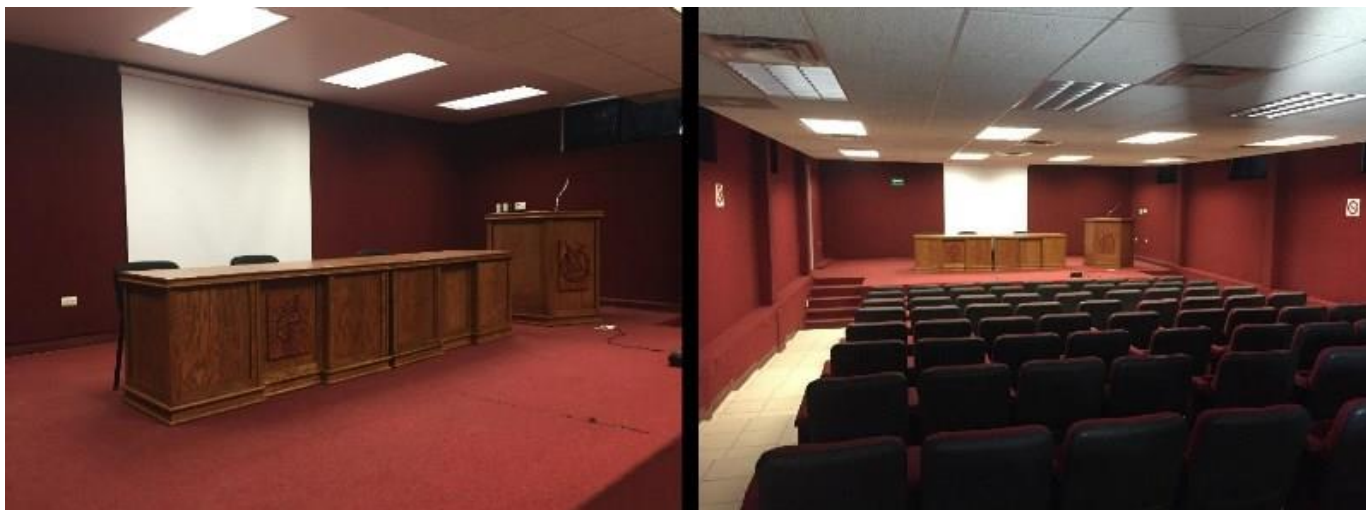
Imágenes del aula magna de la Facultad.

de instituciones públicas, que están vinculadas en nuestro que hacer social, en materia de divulgación, vinculación y extensión.