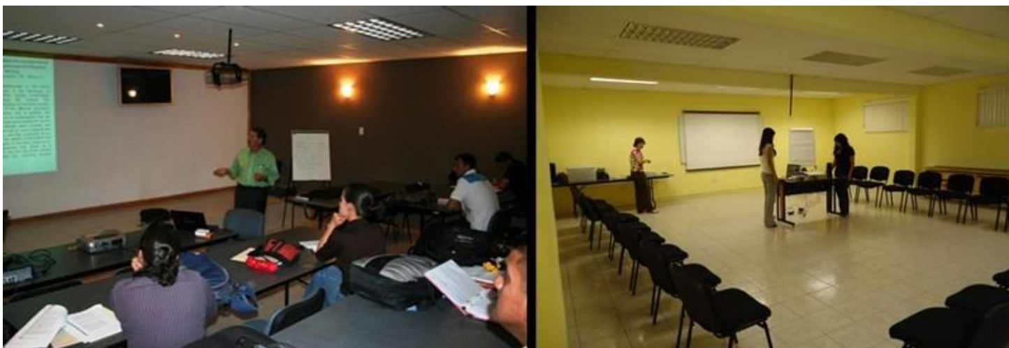
Imágenes de sala de multimedia y de educación continua.

Como ya se citó con anterior, la unidad académica cuenta con salón de multimedia y salón de educación continua, sin embargo se espera que durante el presente año reubicar la Secretaria de Extensión y Vinculación, ampliar las oficinas de la Secretaria de Planeación; y crear un módulo de atención al estudiante donde se encuentre un espacio para medicina de trabajo y estudiantil, nutrióloga y psicóloga.