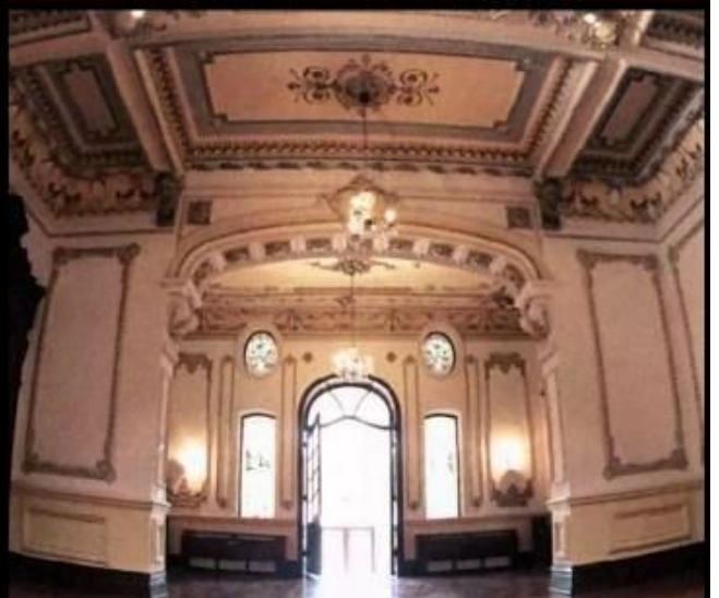
Imágenes de la Quinta Gameros patrimonio universitario y de la humanidad.