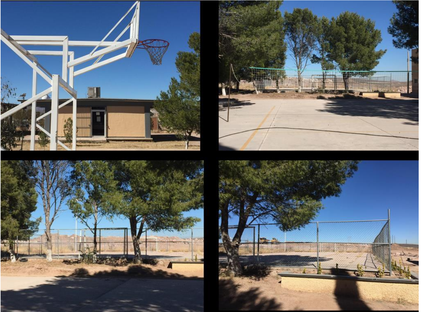
Imágenes de las canchas deportivas en la Facultad.

En el caso de la cancha de volibol se sustituyó toda la plancha de cemento. Con el apoyo de la sociedad de alumnos se cambiaron las canastas de la cancha de basquetbol y se cerró con malla la cancha del futbol rápido, donde cada semestre se lleva eventos deportivos donde participan estudiantes y maestros.