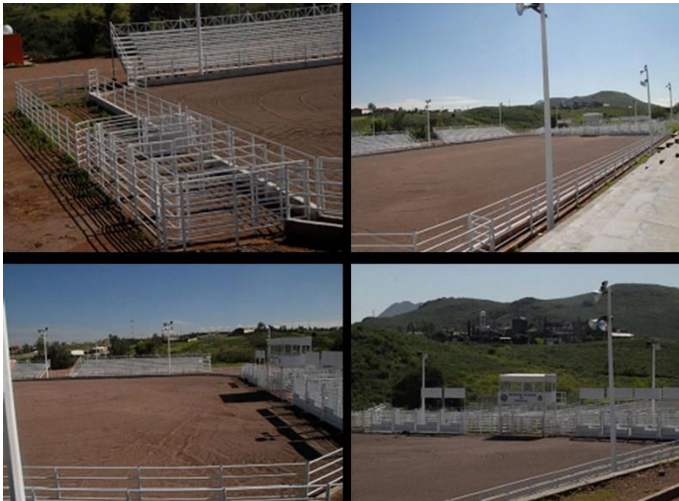
Imágenes de la arena de rodeo patrimonio universitario a cargo de la Facultad.

La Facultad por su propia naturaleza, cuenta con una Arena de rodeo para llevar eventos sociales de mucha acción y diversión con capacidad entre 1 200 hasta 2 500 espectadores. Que se encuentra ubicada a unos 2 km de la Unidad académica, lo que corresponde a la colonia frente al campus de granjas universitarias.