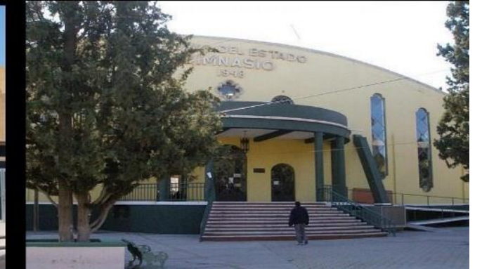
Imágenes de biblioteca central, estadio universitario, alberca olímpica, paraninfo, seminarios, etc.